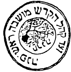
חותמת ועד ראש-פינה